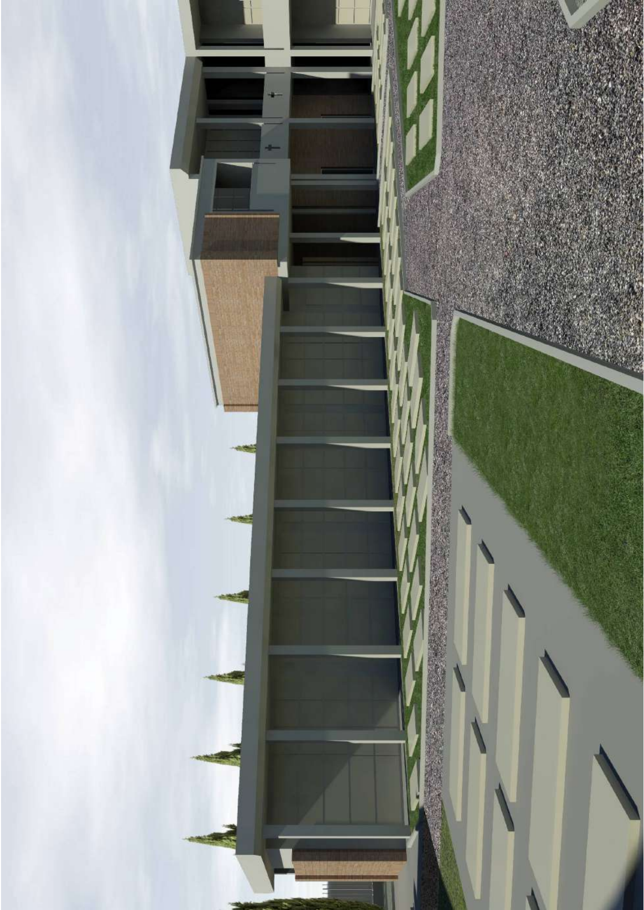
La porzione in ampliamento prevista con il LOTTO 2, vista dall'ingresso carrabile

Architetto FABIANO BERTELLI matr. 752 Sez. A/a ARCHITETTI, PIANIFICATORI, PAESAGGISTI E CONSERVATORI PROVINCIA DI PISA - 10021