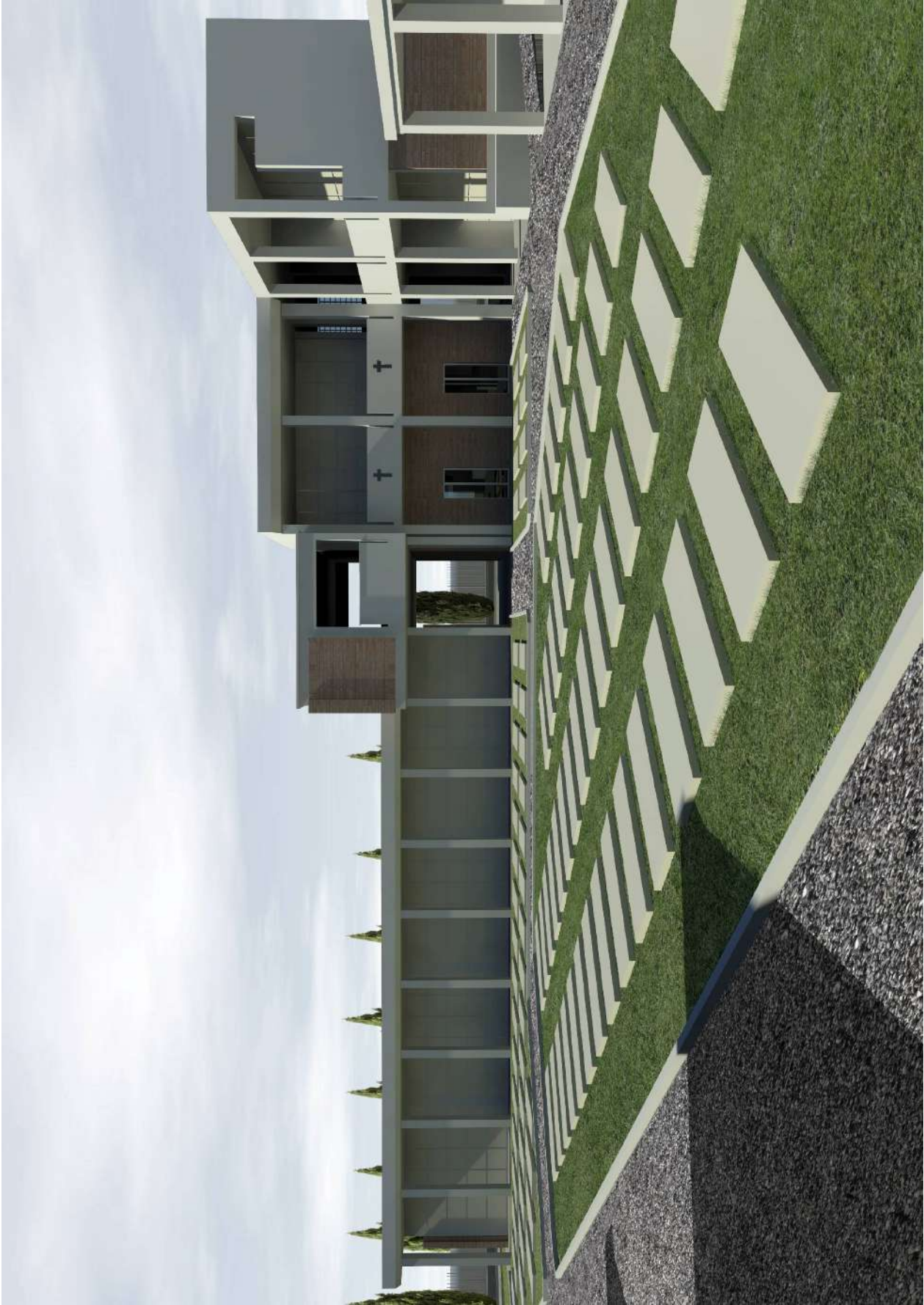
La porzione in ampliamento prevista con il LOTTO 2, vista dall'ingresso alla parte nuova