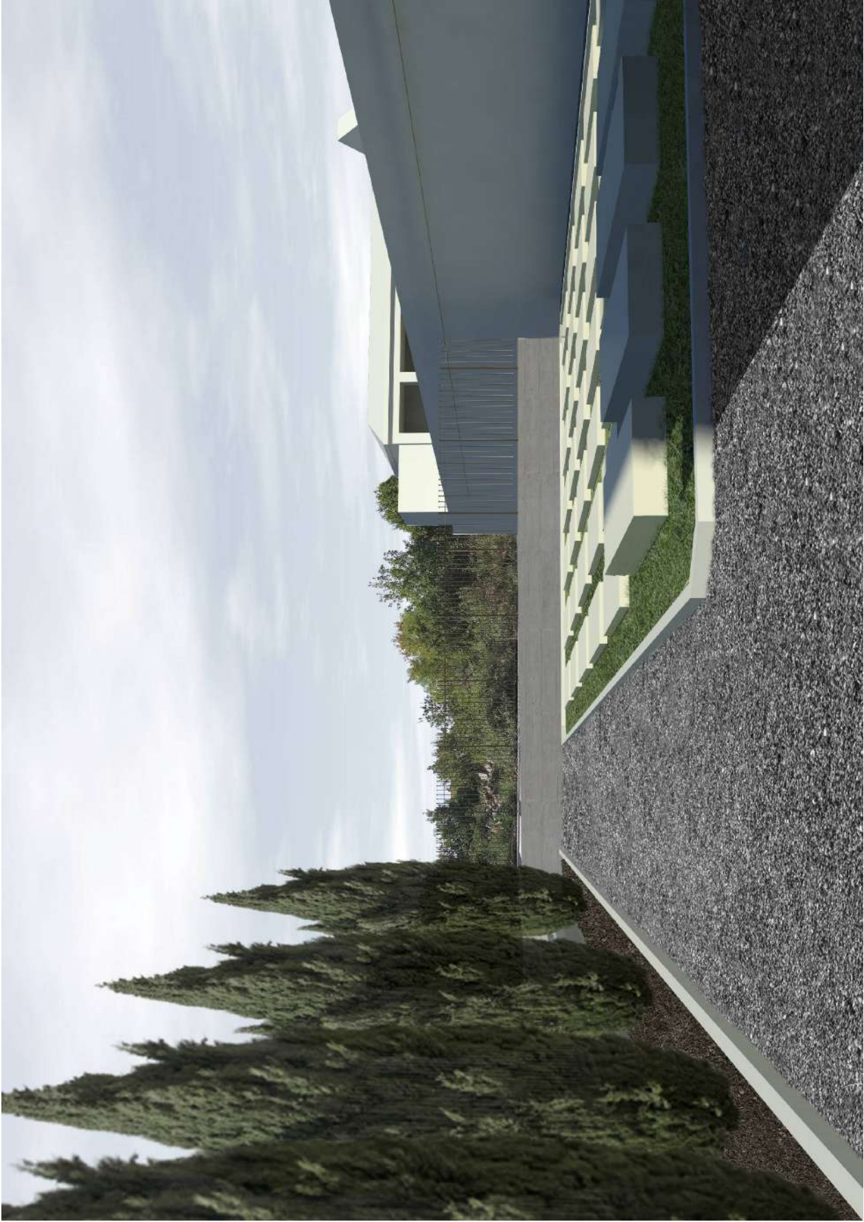
Il Campo Comune in ampliamento prevista con il LOTTO 1, visto dalla strada-viale che chiude il fronte sud

Architetto FABIANO BERTELLI matr. 752 Sez. A/a PROVINCIA DI PISA - SERVIZIO REGISTRAZIONE