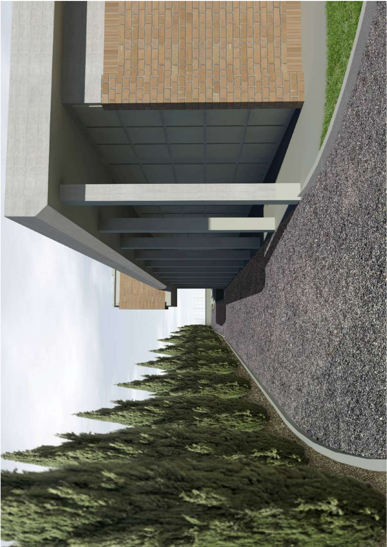
La strada-viale con il filare a cipressi che chiude la nuova area cimiteriale sul fronte sud

Architetto FABIANO BERTELLI matr. 752 Sez. A/a PROVINCIA DI PISA - INGEGNERI, ARCHITETTI, PIANIFICATORI, PAESAGGISTI, ECOSERVIZI